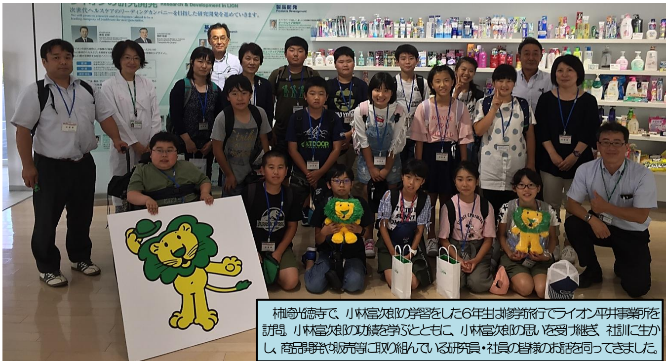
柿崎徳寺で、小林富次郎の学習をした6年生が修学旅行でライオンアパレル事業所を訪問。小林富次郎の功績を学ぶとともに、小林富次郎の思いを受け継ぎ、社訓に生かし、商品開発や販売等に取組んでいる研究員・社員の皆様のお話を伺ってきました。