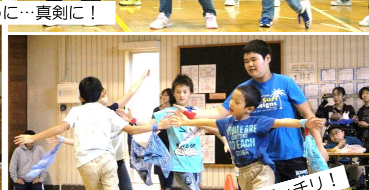
笑顔あふれるダンス！チームワークもバッチリ！