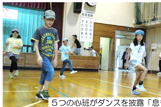
5つの心班がダンスを披露「息もピッタリ！」