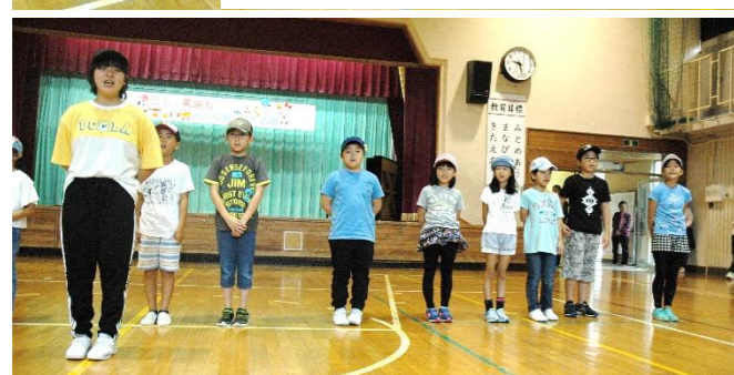
練習したステップを間違わないように…真剣に！