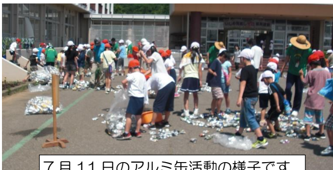
7月11日のアルミ缶活動の様子です。