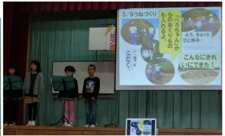
2年生はがんばった野菜作りのことをクイズや詩の朗読を交えながら紹介