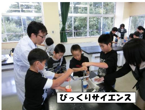
びっくりサイエンス