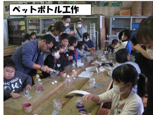
ペットボトル工作