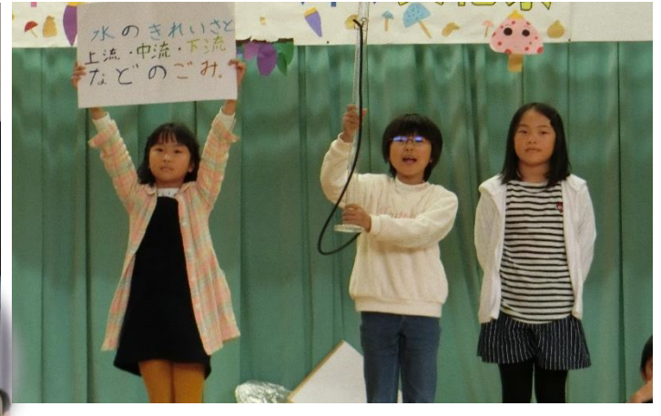
4年生は柿崎川探検ワークショップの宣伝