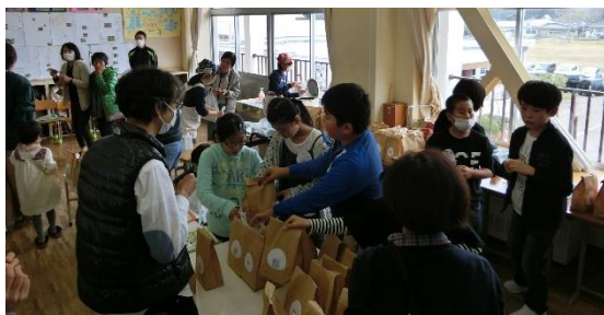
5年生のお米はあっという間に完売！ ありがとうございました！

緊張しながら説明し始めた 四年生・六年生のワークショ ップ。たくさんの方が聞いて くださったおかげで発表もド ンドン上手になりました。