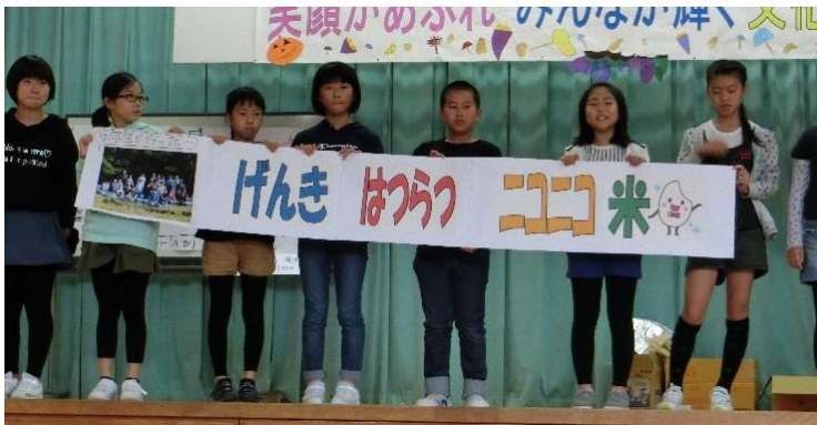
5年生は「米作り」の様子を劇やクイズで発表