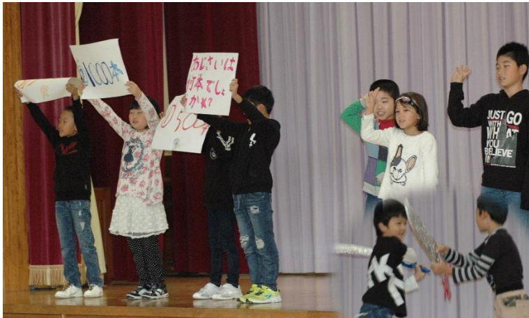
3年生は校区探検のことを過去に遡り、クイズや劇で発表