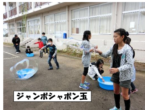
ジャンボシャボン玉