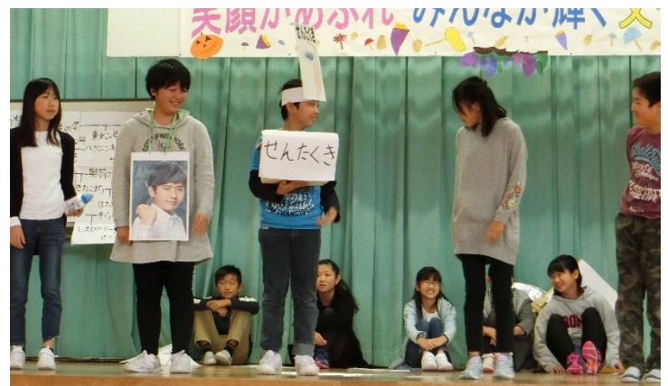
6年生はワークショップの宣伝