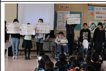
5年生…VS活動について