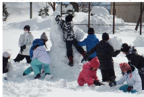
《役割分担して雪のかたまりと格闘》

それから、運営委員会・健康委員会が中心となって、全校雪遊びの準備をしました。あいにく私は出張で全校雪遊びに参加することはできなかったのですが、《シモクロリンピック》と銘打って、全校児童が心班ごとに雪積み競争や宝探し(雪の中の餡探し)を楽しみました。本格的な開会式も行い、《シモクロリンピック》は大成功!