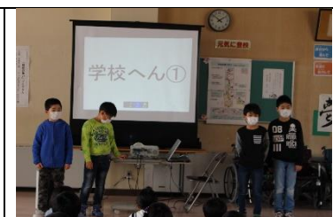
3年生…VS活動について