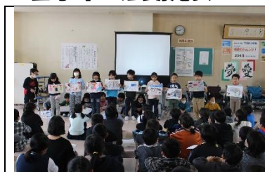
1年生…アルミ缶活動について