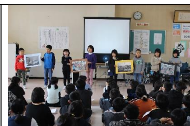
2年生…アルミ缶活動について