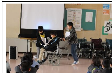
4年生…『よねやまの里』交流