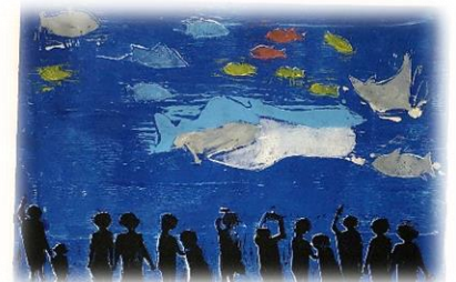
「すてきな うみがたり」6年生作品 (校内版画展作品より)