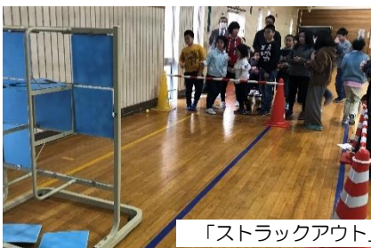
「ストラックアウト」がんばれ〜