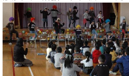
元気いっぱい「USA」を踊る6年生

保護者の皆様、地域の皆様、素直な子どもたちに育ててくださり、ありがとうございました。今後ともよろしく願いいたします。