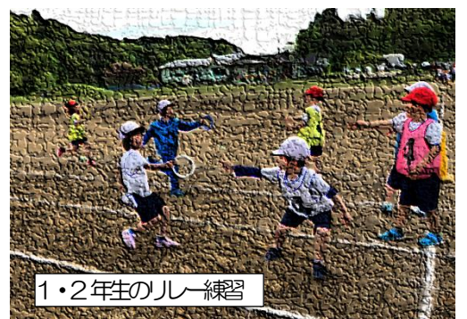
1・2年生のリレー練習