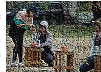
来賓・地区民・中学生が参加した「色水でGO」。3・4年生も参加し、6チームに分かれ、競い合いました。急いで、でも、こぼさず上手に入れたいけません。ボランティアの皆さんが優しく見守ってくださいました。