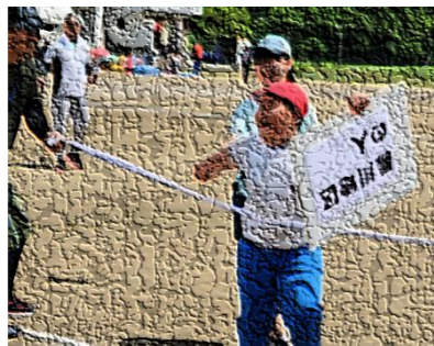
5・6年生「かり人レース」では、借りる人も借りられる人も笑顔でゴール！仲良く手をつないでゴールしていました。