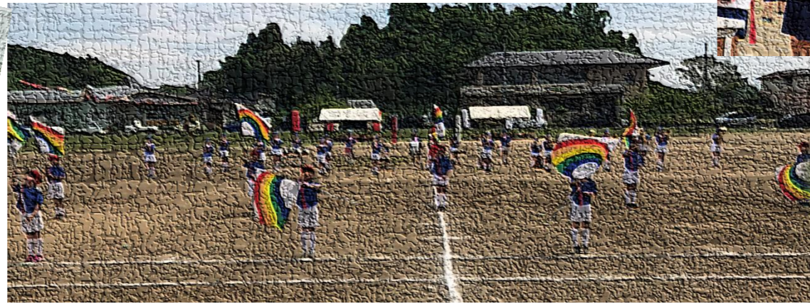
昨年12月に金管引継ぎ式を行い、その後、運動会に向けて練習を重ねてきた金管課外。5・6年生が楽器を、4年生がカラーガードを担当し、「こんにちはトランペット」「RPG」「ゴーゴープラス」の3曲を披露しました。限られた時間の中、心を一つにして練習してきた子どもたち。堂々とした演奏演技に、会場の皆様から大きな拍手をいただきました。ありがとうございました。子どもたちの大きな自信となりました。