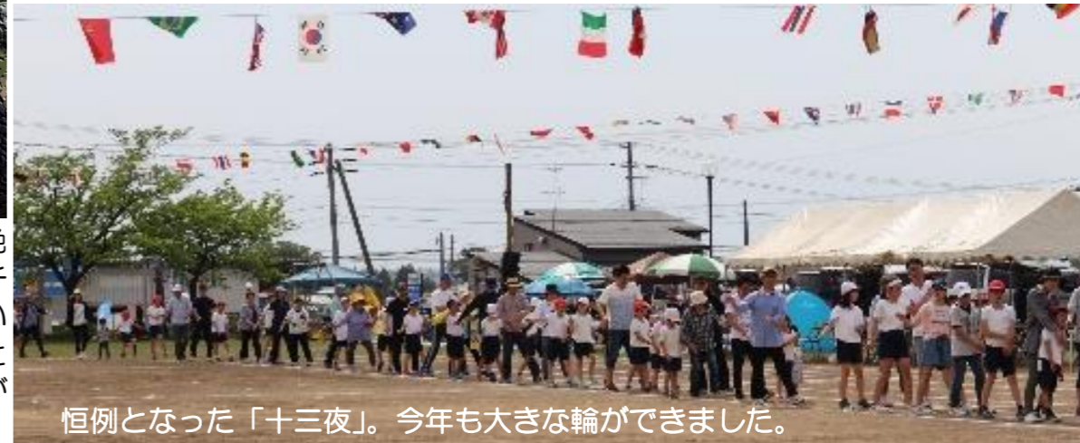
恒例となった「十三夜」。今年も大きな輪ができました。