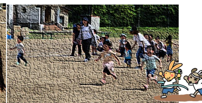
幼児レースに参加した幼児の皆さんは、とっても嬉しそうにゴールを目指していました。お菓子を渡す役員さんとっても嬉しそうでした。