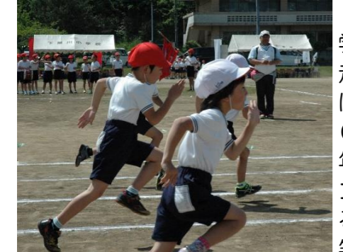
徒競走は低学年50m、中学年80m、高学年100m走ります。リレーは1年生は50m、2年生以上は100m走ります。それぞれの学年に応じ、距離ものびます。ゴールを目指して真剣に走る子どもたち！ゴール後の笑顔がステキでした。