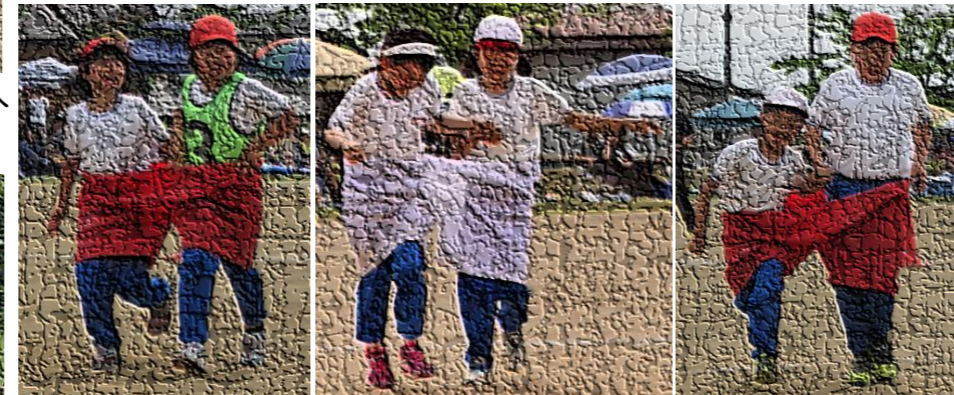
縦割り班(心班)競技「でかパンリレー」 2人ペアで、でかパンをはき、コーンを回ってリレー。AからEの5つの班で競いました。今年度の優勝はC(チョコレート)班でした。互いに相手を気遣いながら走る姿が微笑ましかったです。でかパンは、PTA会計で購入しました。