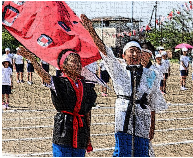
赤組応援団長と白組応援団長の堂々とした選手宣誓！待ちに待った大運動会の始まりです。1年生の開会式の様子も立派でした。