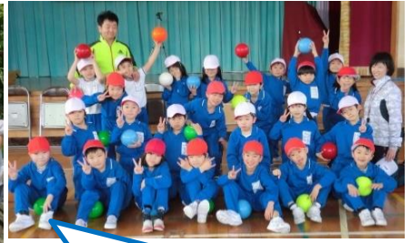
2年生日田は、諏訪(貝瀬)加藤工先生、音声かんぱつたよ、野菜をつくったよ、1年生のお手本「カッコいい2年生」になったよ！