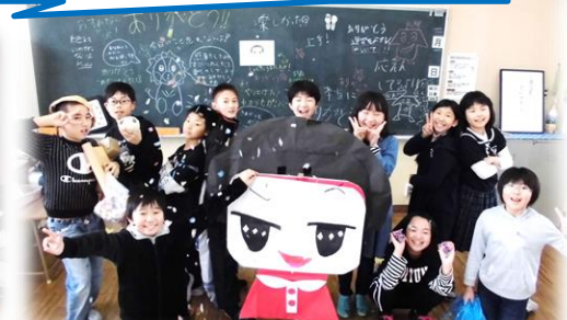
最高学年6年生! 入学式では1年生の手を引いて、運動会では応援リーダー。金管もカッコよかった!