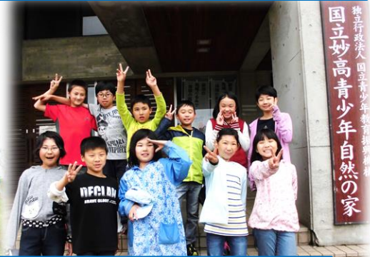
米作り・自然教室・金管・六送会のチコちゃん…全部最高! もちろん蛸巻も! 優しさも