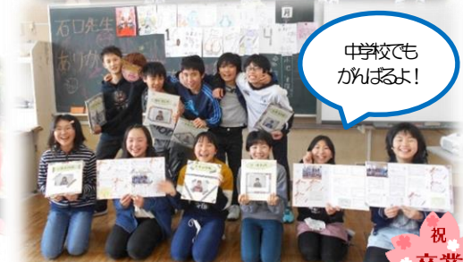
中学校でも がんばるよ!