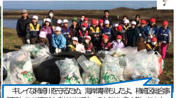
キレイな柿崎を守るため、海岸清掃もしたよ。柿崎区総合事 務所とのやり取りも自分たちで! こんなゴミがあったよ!