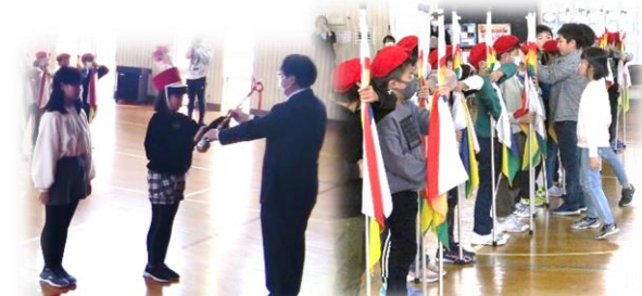
新メンバーへの引継ぎ