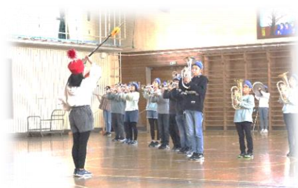
6年生と最後の演奏